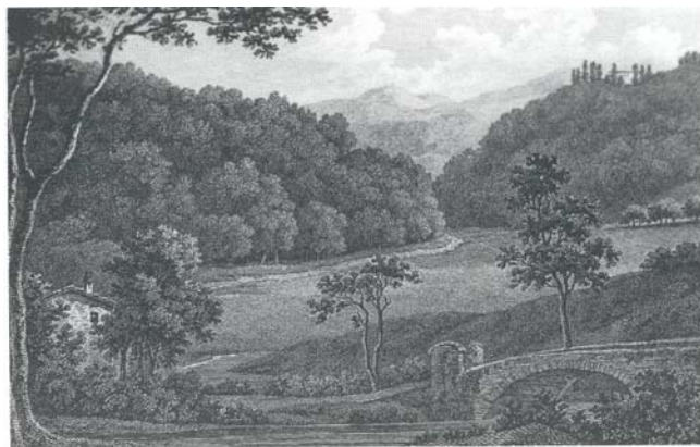
1796 – Vicinanze di Cafaggiolo – John Smith

Interessanti sono le notizie che possiamo ricavare da un Cabreo, con una veduta di Cafaggiolo, del 1732 (Tav. 4 – Veduta dei poderi di Cafaggiolo 1732). Nel frontespizio leggiamo che i terreni sono stati interessati da un miglioramento fondiario, che ha determinato produzioni, di