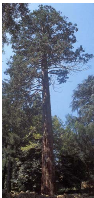
Sequoia gigantea Altezza m 40 Circonferenza m 6 Età 150 anni circa