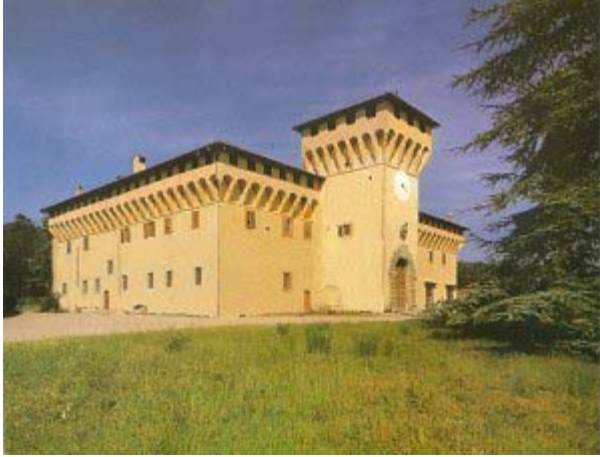
Villa Medicea di Cafaggiolo