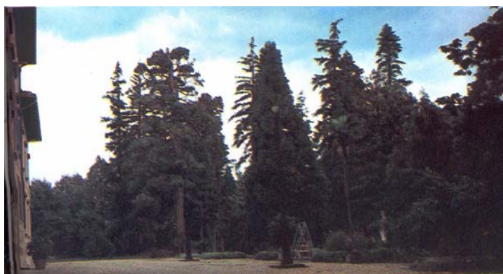
Veduta del parco