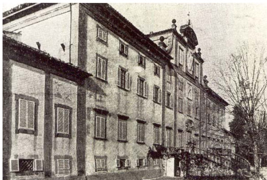
Villa Gerini - Le Maschere Inizio '900