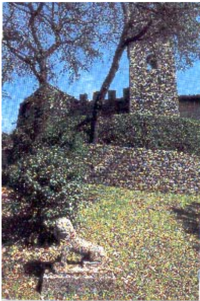
Il castello di Barberino di Mugello