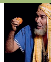
Heina e Il Ghul

Tahar Ben Jelloun è uno degli autori marocchini più conosciuti in Europa. Nei suoi romanzi, scritti in francese, contamina, attraverso una scrittura polifonica e raffinata, la tradizione araba scritta e orale con i moduli della narrativa moderna e postmoderna. Intorno ai primi anni '60 Ben Jelloun inizia la sua carriera di scrittore ed è in questo periodo che partecipa attivamente alla stesura della rivista "Souffles" che diventerà uno dei movimenti letterari più importanti del Nord-Africa. Dopo aver conseguito la laurea in filosofia si trasferisce in Francia dove frequenta l'università di Parigi. Nella seconda metà degli anni '70 scrive testi importanti in cui tratta della condizione degli emigrati magrebini in Francia. La pubblicazione nel 1987 del romanzo La Nuit sacrée (La notte fatale), con cui ha vinto il premio Goncourt, lo ha designato quale scrittore di fama internazionale. Da allora i suoi testi sono diventati sempre più numerosi e diversificati, ha scritto romanzi, poesie, opere teatrali, saggi, riuscendo ad apportare in ognuna delle sue opere elementi innovativi rispetto alla tradizione a cui egli stesso guardava. Le tematiche trattate sono molteplici ma si basano tutte su argomenti scottanti e sempre attuali come l'emigrazione, la ricerca d'identità, la corruzione. In Italia molte sue opere sono tradotte e conosciute, ma la più nota al grande pubblico è probabilmente Il razzismo spiegato a mia figlia , edita nel 1998 e ripubblicata nel 2018 da La Nave di Teseo.