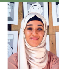
Takoua Ben Mohamed

Scrittrice albanese che vive in Italia da oltre venti anni. Il suo primo romanzo Rosso come una sposa , pubblicato con Einaudi nel 2008, che ha vinto diversi premi, narra le storie di tre generazioni al femminile nell'Albania di ieri e quella di oggi. Per Einaudi ha pubblicato anche L'amore e gli stracci del tempo (2009), in cui racconta la guerra nei Balcani, quella squarciata dai nazionalismi, fra Kosovo e Serbia. Protagonisti due giovani innamorati, lui serbo lei kosovara, divisi dalla guerra. Con il suo ultimo libro, pubblicato nel 2017, Il tuo nome è una promessa , rievoca le vicende tormentate di una famiglia di ebrei in fuga dalla Berlino nazista all'Albania di re Zog. Scrive in italiano, ambienta i suoi romanzi in Albania, o al più lontano in Kosovo, e pur vivendo da oltre vent'anni in Italia non si sente una voce della diaspora. Nei suoi romanzi ripercorre l'identità della donna balcanica nel Novecento, da una cultura patriarcale e "islamizzata" fino al comunismo. Lei stessa ritiene di riuscire a fare questo perché la ricostruzione dei suoi ricordi e delle sue impressioni è avvenuta altrove, in un luogo neutro, forte di una distanza molto netta, sia geografica che linguistica. "Io sono e rimarrò sempre albanese, ma come scrittrice non lo sono mai stata. E' vero però che non sono nemmeno una scrittrice italiana, perché comunque sono approdata alla letteratura italiana che ero già adulta. Forse la cosa più corretta da dire è che sono una scrittrice italoфона".