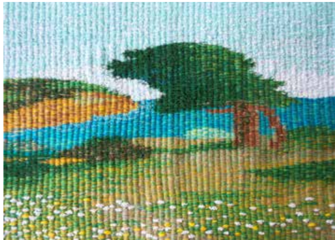
CAPO PECORA - luglio 2001 Arazzo - cotone, seta - cm 29 x 45

IN OCCASIONE DI "UN FILO DI..." 18 GIUGNO 2017 Sala di Palazzo Pretorio Dal 17 al 30 Giugno 2017