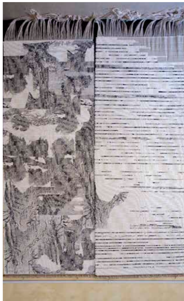
RACCONTO ILLUSTRATO - due rotoli (A-B) - luglio 2012 Arazzi - cotone e frammenti di xilografate stampate su carta - cm 230 x 100 ciascuno