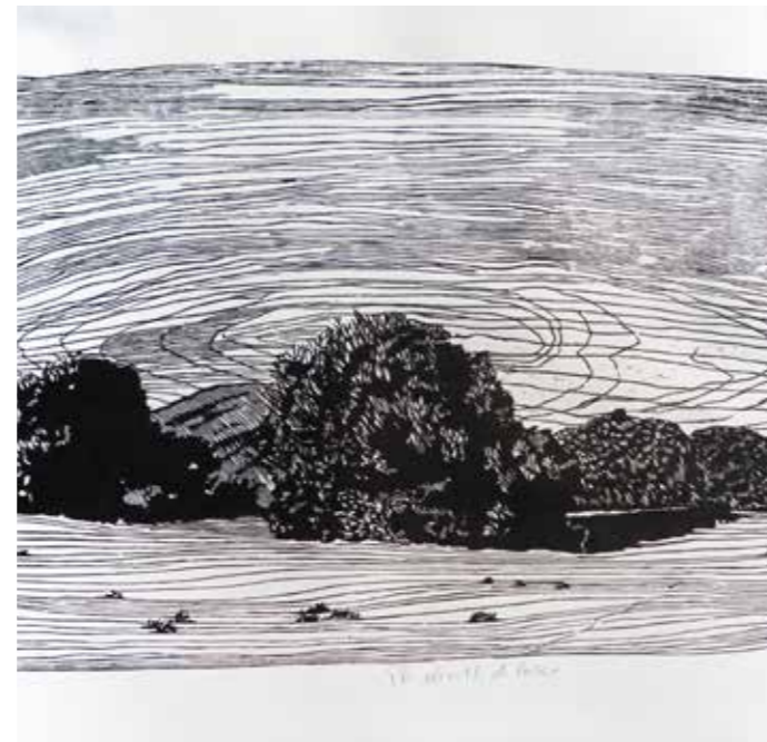
L' OLIVASTRO DI LURAS - 2013 xilografia - legno di pero di filo cm 75 x 36 matrice irregolare