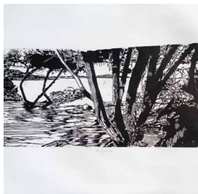
LI PISCINI I - 2015 xilografia - legno di pero di filo cm 85 x 26 matrice irregolare