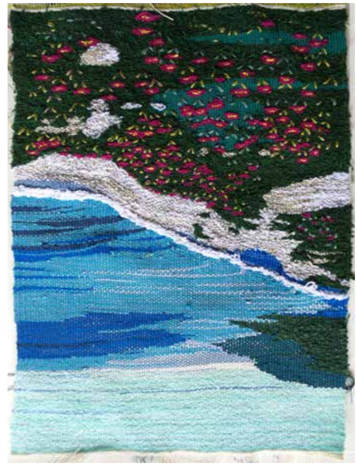
PROFUMI - agosto 2014 Arazzo - Cotoni, sete - cm 27 x 20

La manifestazione "Un filo di..." nasce cinque anni fa come iniziativa dedicata al mondo del lavoro a maglia, a uncinetto, al ricamo e all'intreccio riprendendo le tradizioni del nostro territorio, dove il ricamo e la maglia in generale sono stati il simbolo di generazioni e si sono poi evolute sperimentando tecniche più moderne.