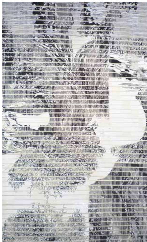
RACCONTO ILLUSTRATO (particolare) - luglio 2012 Arazzi - cotone e frammenti di xilografate stampate su carta - cm 230 x 100 ciascuno